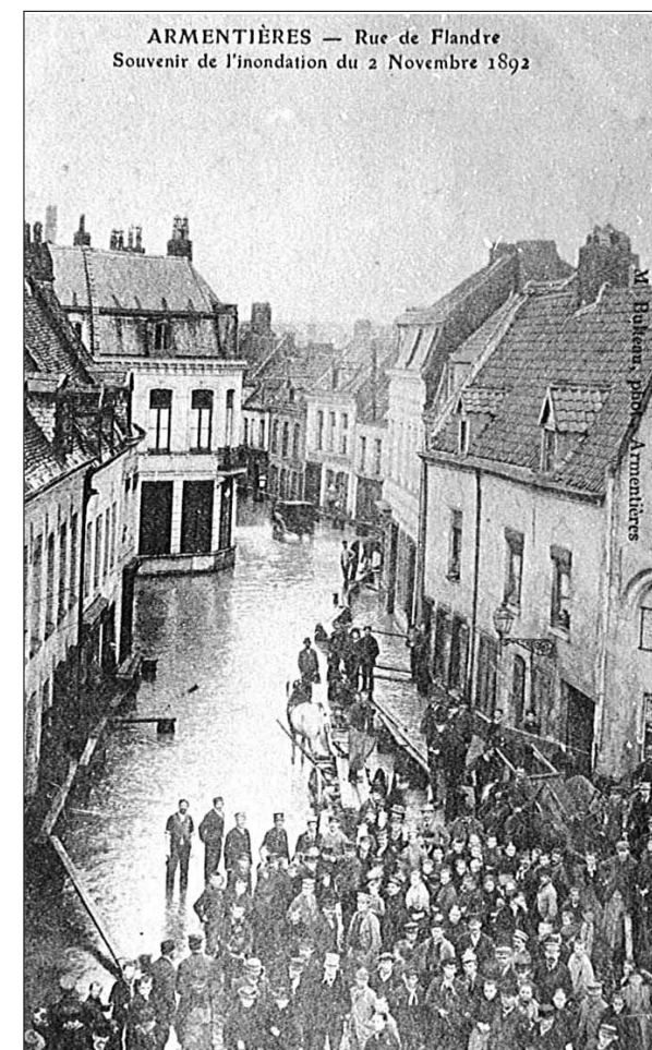
Carte postale de la rue de Flandre (rue des fusillés aujourd'hui) pendant l'inondation du 2 Novembre 1892 3 Fi 290

Nous conservons dans nos archives une série de photographies, cartes postales et autres plans qui retracent la vie de la rivière, de sa première dérivation à la Lys que nous connaissons aujourd'hui.