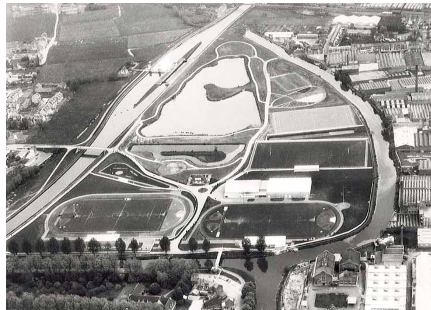
Vue aérienne du complexe sportif et de la Lys au début 1970.