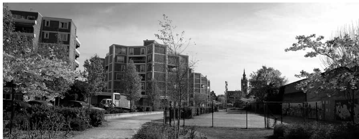
La coulée verte juin 2014.