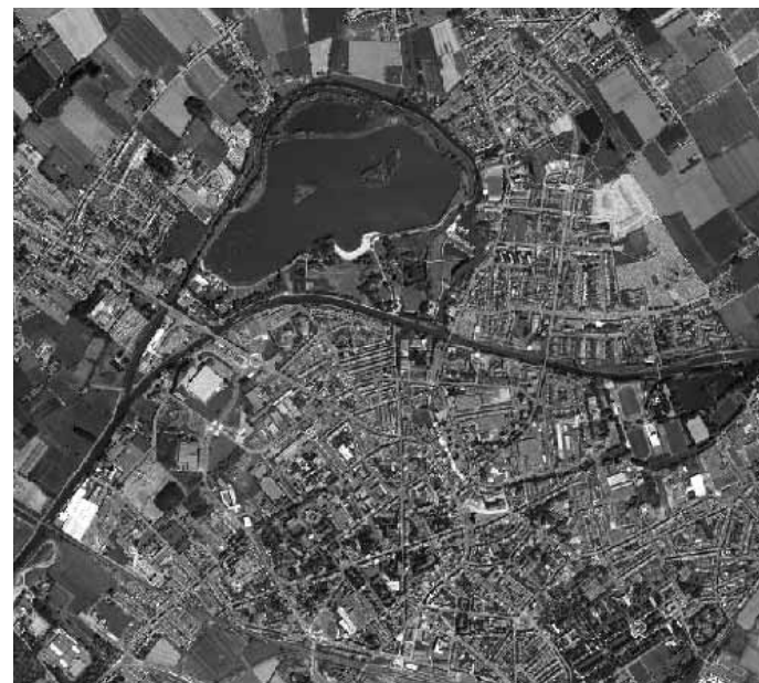
La Lys en 2008.

■ 4 décembre 1971 : début des travaux du pont de l'Île de Flandre.